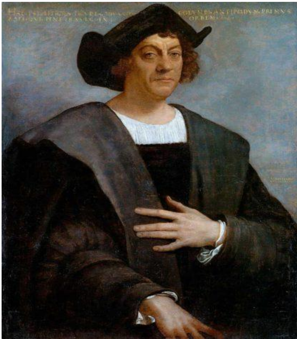
Portret Krzysztofa Kolumba