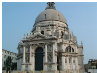
Kościół Santa Maria della Salute w Wenecji

Przyjrzyj się przedstawionym budowlom – jedna z nich powstała w epoce baroku, druga – zbudowana w stylu klasycystycznym. Zastanów się, która z nich jest barokowa i czym różnią się od siebie.