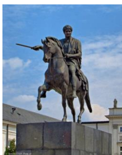
Pomnik księcia Józefa Poniatowskiego w Warszawie