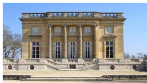
Petit Trianon w Wersalu

Przypominam o wysłaniu poprzednio zadanych prac na adres: 3marzanna3@wp.pl .