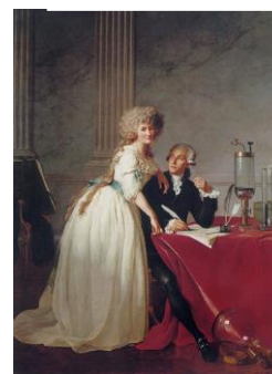
Jacques-Louis David, Portret państwa Lavoisier

Wiadomości na ten temat znajdziesz w podręczniku szkolnym na stronie 58- 59 i na stronie: